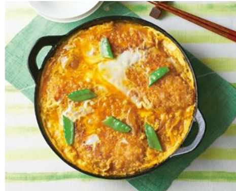
キット内容・調理例(大きなとり天の卵とじ)