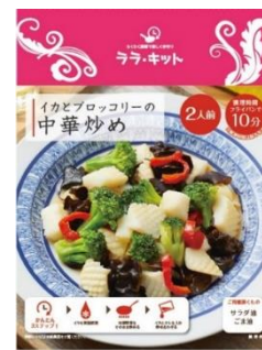
イカとブロッコリーの中華炒め