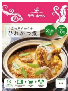
ふんわりやわらかひれかつ煮