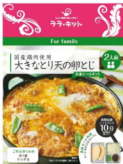
大きなたりの卵とじ