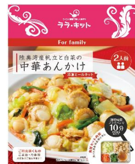
陸奥湾産帆立と白菜の中華あんかけ