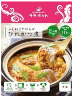
ふんわりやわらかひれかつ煮