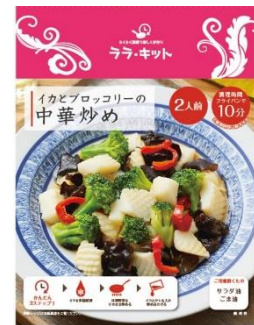
イカとブロッコリーの中華炒め