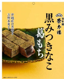
黒みつきなこ葛もち 90g