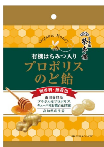
有機はちみつ入りプロポリスのど飴 60g