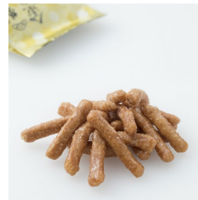
金のはちみつかりんとう 盛り付け図