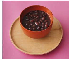
ぜんざい 盛り付け図