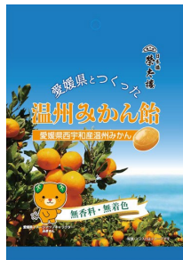
愛媛県とつくった温州みかん飴 80g