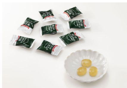
プロポリスのど飴 盛り付け図