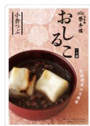
おしるこ 小倉つぶ 160g