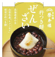
杵つき餅ぜんざい 130g