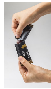
ひとくちようかん はちみつ・黒糖 4本