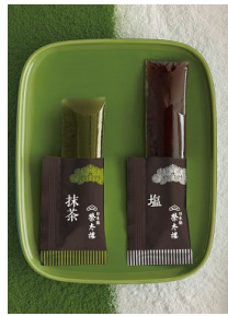
ひとくちようかん 塩・抹茶 中身画像