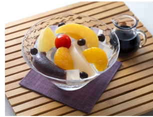
あんみつ 盛り付け画像