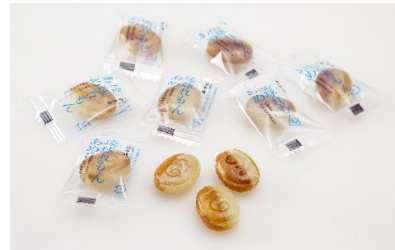
琉球れもんあめ 中身画像