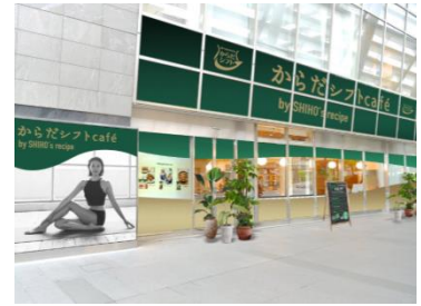
『からだシフト Café』外観イメージ