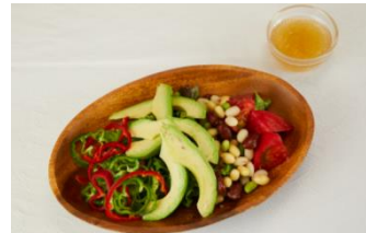
アボカドビーンズサラダ