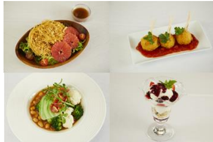
「からだシフト」を使用したアレンジレシピ