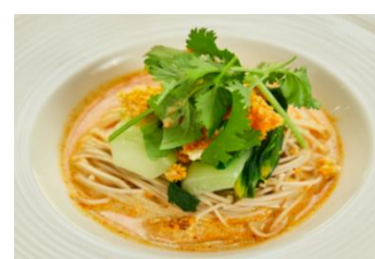
おからの冷製豆乳担々そば

『からだシフト Café』では、健康は自身で管理する時代に変わりつつある中、食生活の改善において、“おいしさ”“バラエティ感”、そして“簡単に”できる、糖質制限やたんぱく質の摂取などの食生活支援をカフェスタイルで提案します。SHIHO さんイチオシの、食欲が失われがちな残暑が続くこの時期に嬉しい「おからの冷製豆乳担々そば」や「台湾風かき氷」、定番メニューのピザやドリア、ハンバーグまで、和洋中幅広いジャンルで「からだシフト」を活用したアレンジメニューをご用意しています。