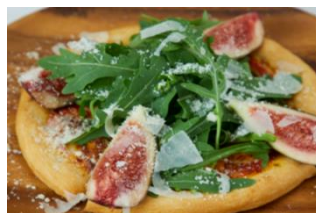
セルバチコとイチジクのピザ