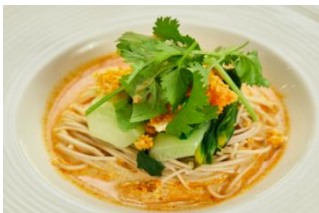
おからの冷製豆乳担々そば