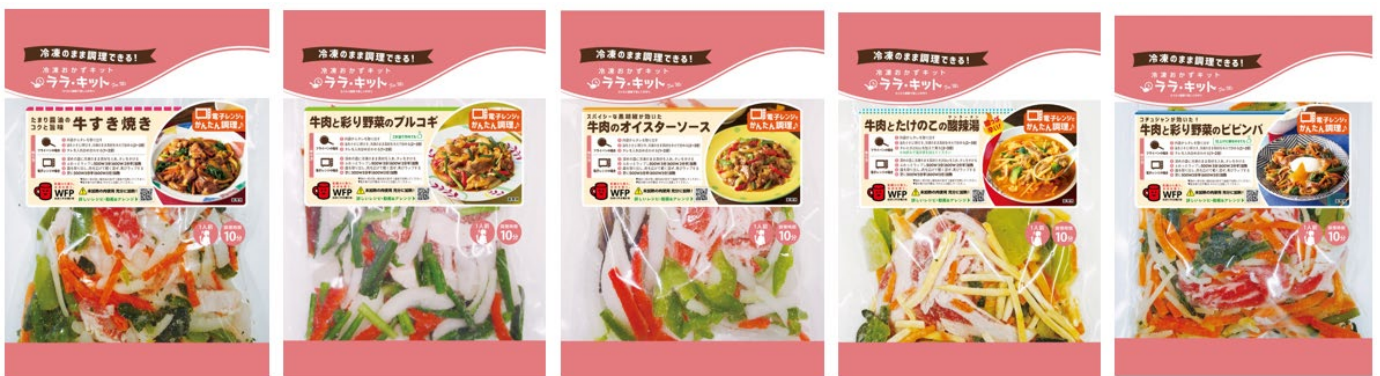
(左から)牛すき焼き・牛肉と彩り野菜のブルコギ・牛肉のオイスターソース・牛肉とたけのこの酸辣湯・牛肉と彩り野菜のピビンバ