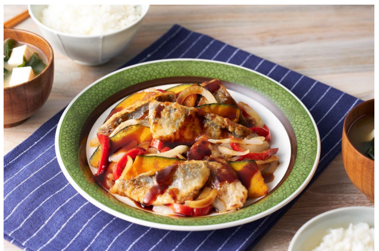
(キットの中身と調理例)