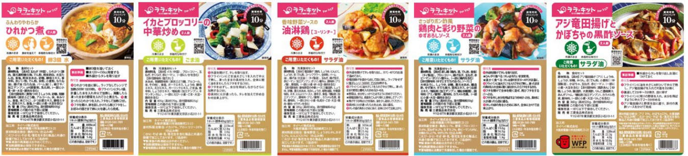
(左から)ひれかつ煮・イカとブロッコリーの中華炒め・油淋鶏・鶏肉と彩り野菜のゆずおろしソース・アジ竜田揚げと かぼちゃの黒酢ソース