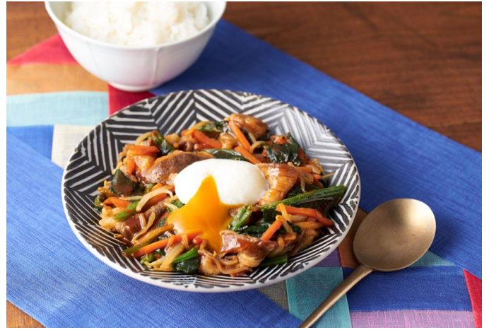
(キットの中身と調理例)