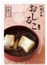
おしるこ 小倉つぶ 160g