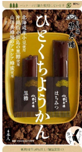
ひとくちようかん はちみつ・黒糖 4本