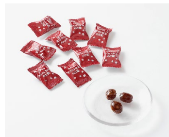
セイロン紅茶のど飴 イメージ図