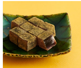
黒みつきなこ葛もち 盛り付け図