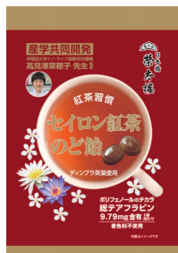
セイロン紅茶のど飴 80g