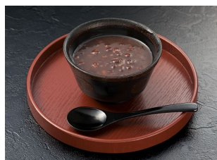
おしるこ 小倉つぶ 盛り付け図