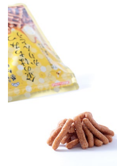
金のはちみつかりんとう 盛り付け図