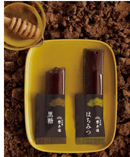
ひとくちようかん はちみつ・黒糖 イメージ図