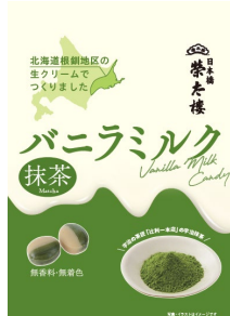
抹茶バニラミルク 70g