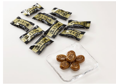
黒みつ飴 イメージ図