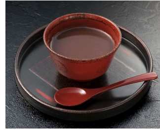
おしるこ 御膳こし 盛り付け図