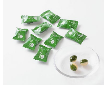
抹茶バニラミルク イメージ図