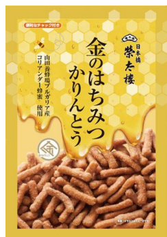
金のはちみつかりんとう 90g