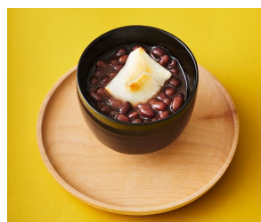
杵つき餅ぜんざい 盛り付け図