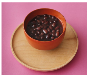
ぜんざい 盛り付け図