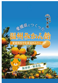
愛媛県とつくった温州みかん飴 80g