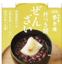
杵つき餅ぜんざい 150g