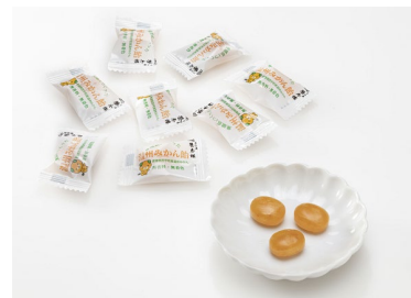
愛媛県とつくった温州みかん飴 イメージ図