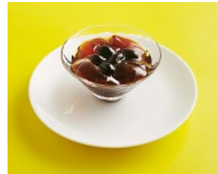
黒みつ寒天 やわらか仕立て黒豆入り 130 g