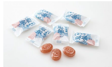
塩飴ほんのり梅味 80 g