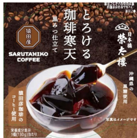
とろける珈琲寒天 黒みつ仕立て 130g