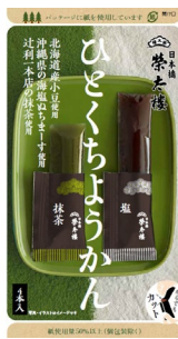
ひとくちようかん 塩・抹茶 4本