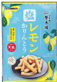
塩レモンかりんとう 70g