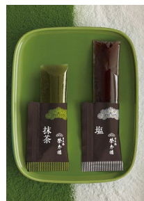
塩・抹茶中身画像